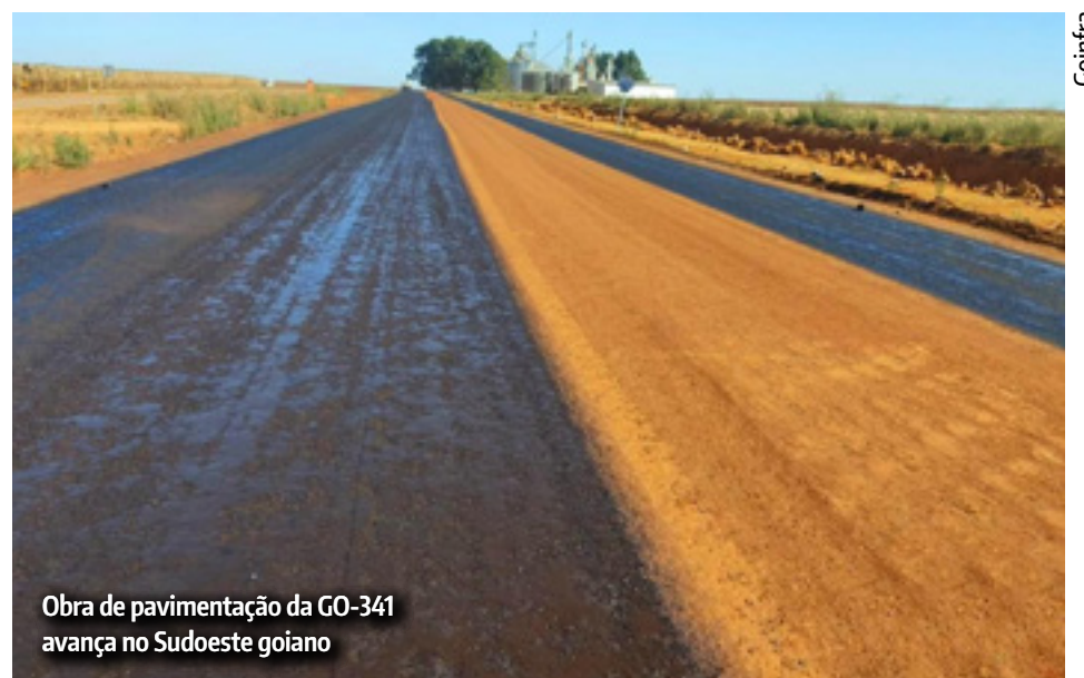
Obra de pavimentação da GO-341 avança no Sudoeste goiano

O investimento do Governo de Goiás na região do Sudoeste goiano é contínuo. Na primeira quinzena deste mês também foi concluída a pavimentação do trecho da GO-306 entre Mineiros e Chapadão do Céu, com mais de 31 quilômetros de asfalto novo.