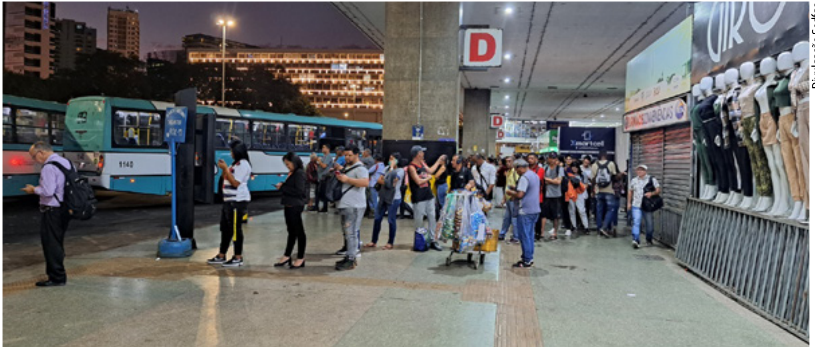
Governo de Goiás mobiliza população votar pela inclusão de projetos que beneficiam o transporte coletivo no Entorno do DF no Plano Plurianual do governo federal

mobilizado a população pela aprovação das propostas. A primeira (5969) é para criação do Consórcio Interfederativo da Região do Entorno do DF. Ele vai integrar os governos de Goiás e DF com a União para melhorar o transporte coletivo da Região Metropolitana do Entorno (RME), com plataformas multimodais que trarão eficiência, conforto e segurança aos