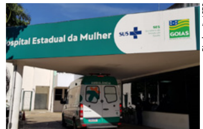
Pioneiro no Brasil, Ambulatório de Atendimento a Vítimas de Violência Sexual (AAVVS) no Hemu conta com atendimentos de psicologia, serviço social, enfermagem e ginecologia