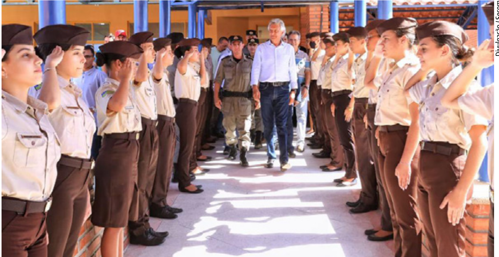
Governador Ronaldo Caiado sobre os Colégios Estaduais da Polícia Militar de Goiás: “Sabemos o quanto o colégio militar tem trazido resultados no Ideb e na boa formação”

E m comunicado emitido nesta quinta-feira (13/07), o governador Ronaldo Caiado tranquilizou a população a respeito da decisão do governo federal de encerrar o Programa Nacional das Escolas Cívico-Militares (Pecim). O chefe do