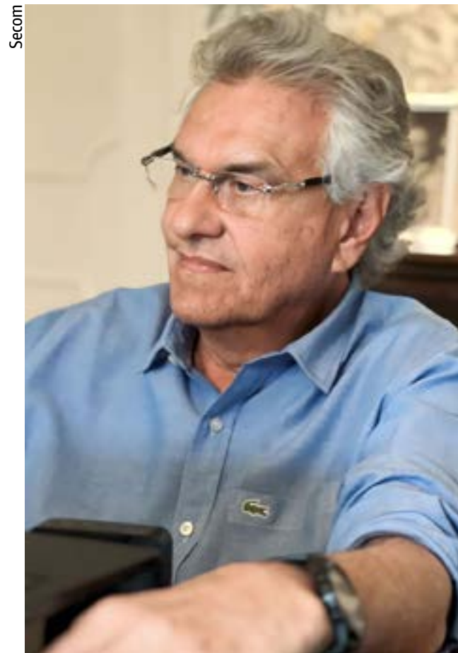
Governador Ronaldo Caiado expõe preocupações com Reforma Tributária durante reunião com governadores do Centro-Oeste

Segundo Caiado, todas as preocupações exigem atenção. "Sou favorável à simplificação, mas não tirando as prerrogativas dos entes federados. Não é uma verdade que o IVA vai trazer crescimento e melhorar a vida das empresas no Brasil. Pelo contrário, vai trazer uma instabilidade muito forte no primeiro momento e a tendência é provocar um recuo nos investimentos". O governador disse ainda que estudos de técnicos da área econômica do Es-