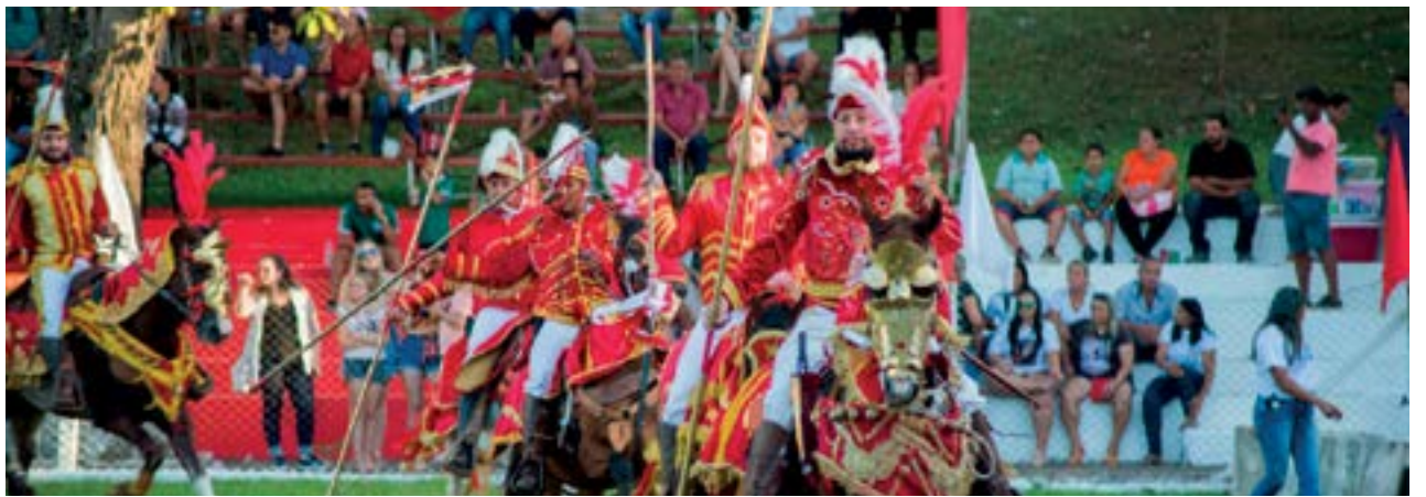
Com investimento de R$ 3 milhões do Governo de Goiás, Circuito das Cavalhadas passa por 13 municípios neste ano; Cidade de Goiás fecha programação, em outubro

Em Pirenópolis, o Cavalcódromo foi readequado para que o local pudesse receber com uma estrutura mais completa as batalhas entre mouros e cristãos. Já foi anunciada também uma segunda reforma no espaço para