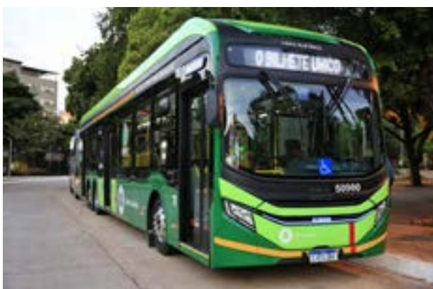
Caiado e secretários utilizam transporte gratuito, oferecido pelo Governo de Goiás, em ônibus elétricos para chegar a Campus Party