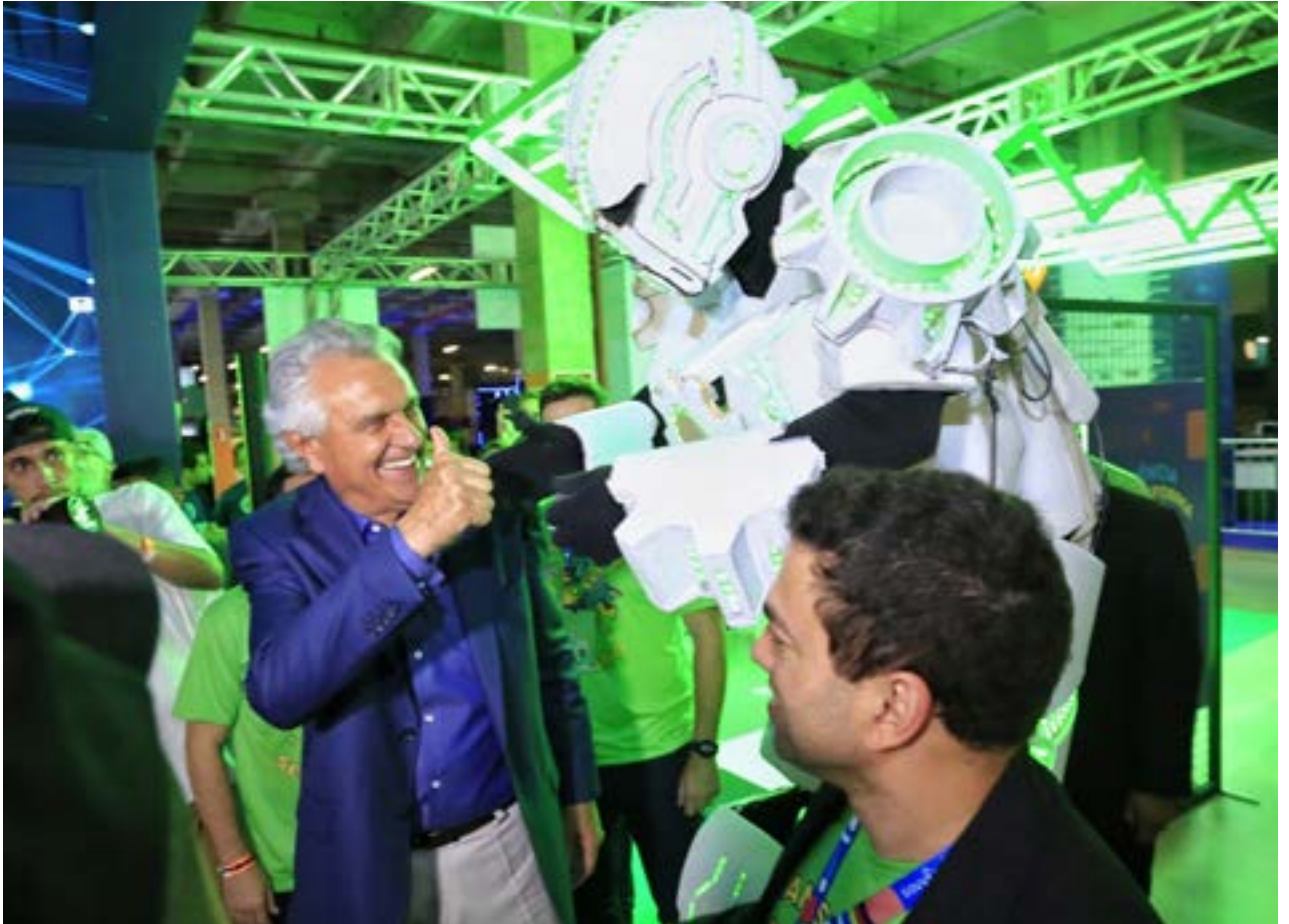
Governador Ronaldo Caiado na abertura da Campus Party Goiás 2023 no Passeio das Águas Shopping