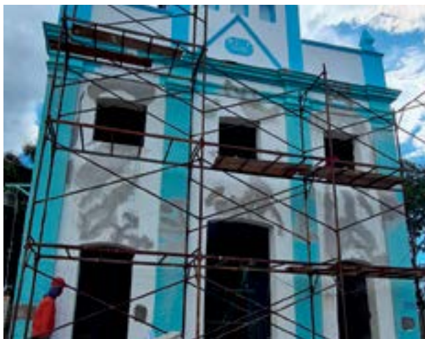
Igreja Nossa Senhora Aparecida, no povoado de Areias, na Cidade de Goiás: restauração deve ser concluída nos próximos meses

dos goianos também teve um aumento de 10,1%, quando comparado ao mesmo período do ano anterior.