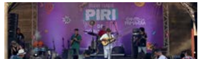
Além de realizar investimentos em todas as áreas, o Governo de Goiás deixou para trás histórico de dívidas e falta de compromisso com setor cultural

Desde 2019, o Governo de Goiás investiu mais de R$ 450 milhões na área da cultura. O montante foi utilizado para ampliar as ações, quitar dívidas deixadas por gestões anteriores, realizar eventos e abrir novos editais de incentivo, além de obras para revitalização do patrimônio histórico.