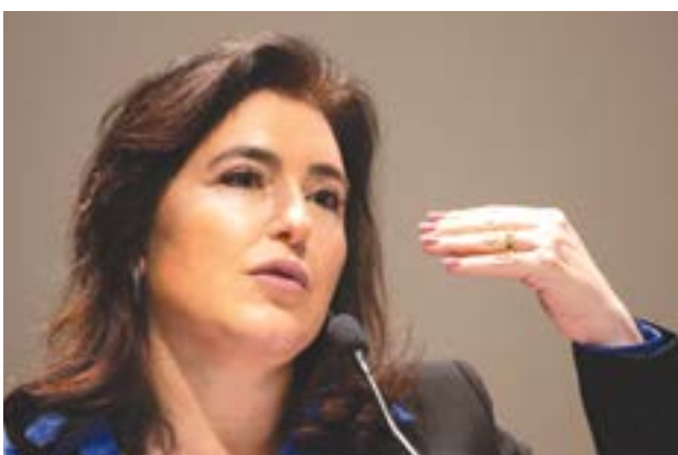
Fabio Rodrigues-Pozzebom/Agência Brasil

A ministra do Planejamento e Orçamento, Simone Tebet, afirmou nesta segunda-feira (29) que os ministérios da Educação e da Saúde, além das “pastas menores”, com orçamentos pequenos, não serão abrangidas pelo bloqueio orçamentário de R$ 1,7 bilhão que o governo deve