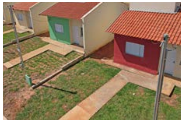
Modelo de casa a custo zero: Bom Jesus de Goiás entra para lista de municípios com famílias definidas e Joviânia inicia obras

Os eventos contarão com a presença do presidente da Agehab, Alexandre Baldy, e do secretário da Infraestrutura, Pedro Sales. “É determinação do governador Ronaldo Caiado manter ritmo nos atendimentos aos municípios e assim cumprir a meta de atender todos com ações