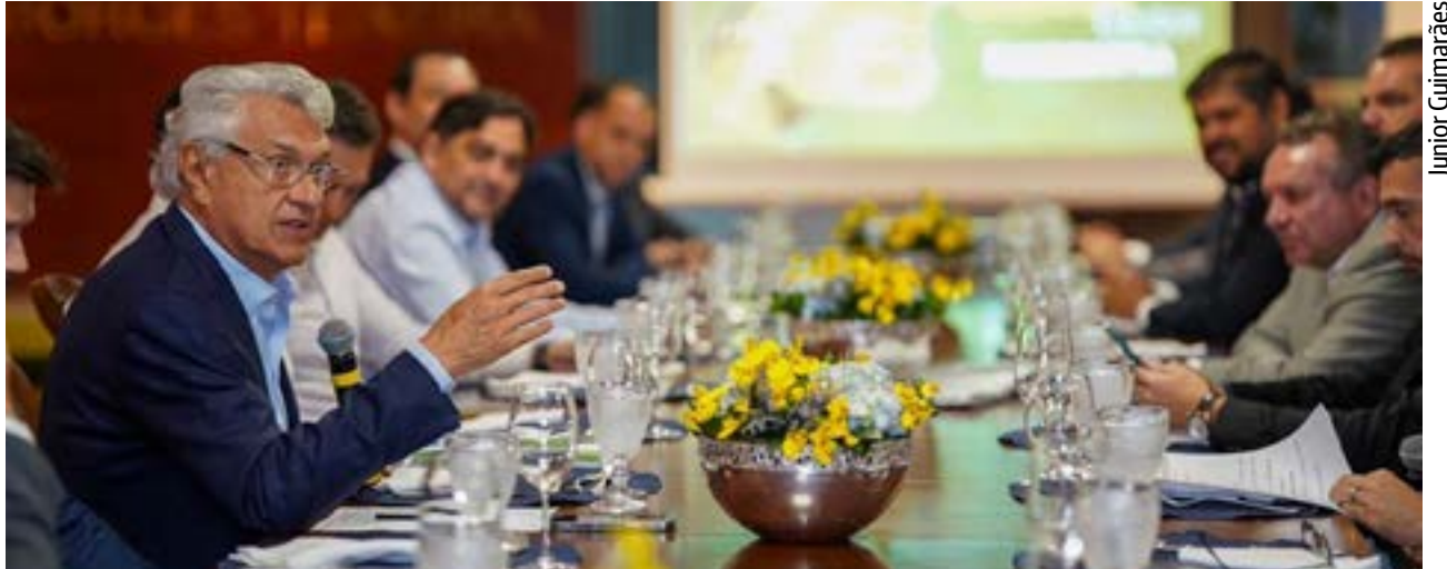
Ronaldo Caiado anuncia três obras em rodovias aprovadas pelo Conselho Gestor do Fundeinfra para execução com recursos do Fundo