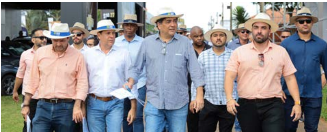
O presidente e vários deputados integraram a comitiva do governador Ronaldo Caiado na abertura oficial da 20ª edição da Tecnoshow Comigo

“A Assembleia Legislativa vem caminhando de mãos dadas com o Governo estadual e trabalhando diuturnamente para servir a nossa população. E hoje