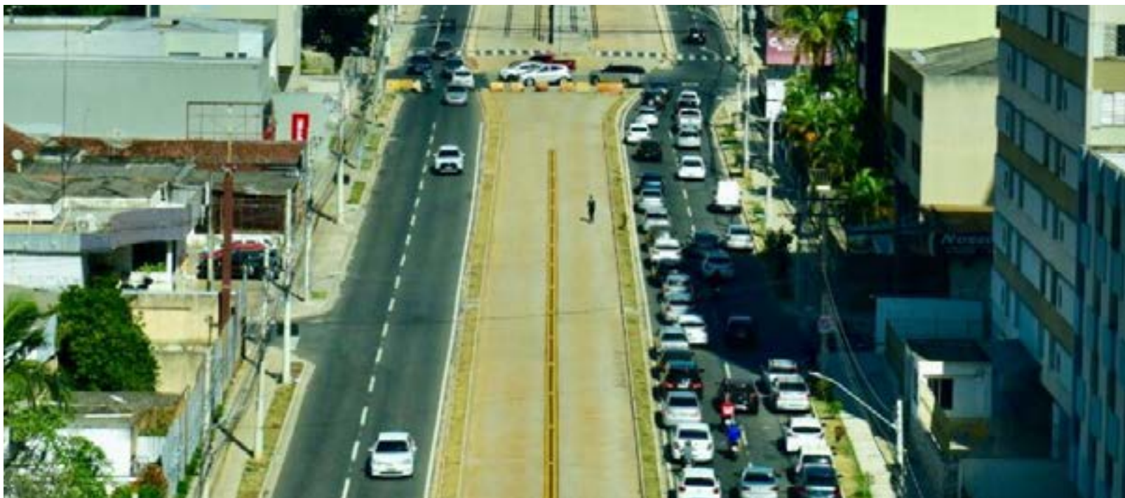
Quem não apresentar o alvará perderá a isenção neste ano e poderá ser cobrado pelo imposto com data retroativa a maio de 2019

Para renovar a isenção em 2023 é preciso apresentar o alvará de licença ou permissão, fornecido pela prefeitura. Não há necessidade de o contribuinte comparecer à Secretaria para se regularizar