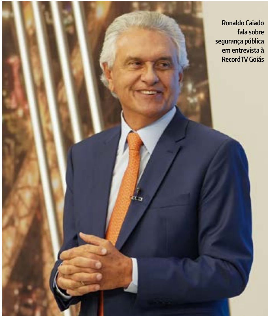
Ronaldo Caiado fala sobre segurança pública em entrevista à RecordTV Goiás

O governador lembrou que o combate ao feminicídio é uma bandeira que ele carrega desde que atuava no Legislativo. Já enquanto governador, tem garantido o reforço da Patrulha Maria da Penha pelo estado e, no início deste