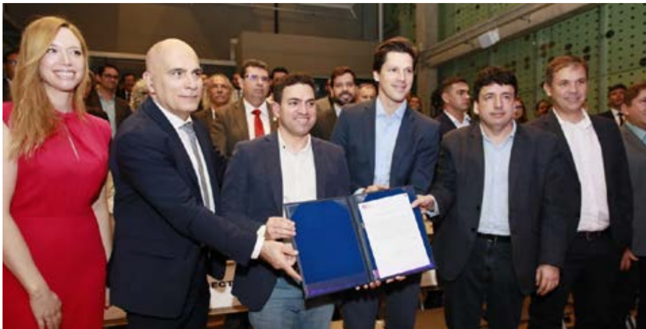
Governo de Goiás lança pacto pela inovação em solenidade realizada no HUB Goiás, em Goiânia

“O que trazemos aqui não é uma receita pronta, mas todo o trabalho e potencial do Estado. Tudo