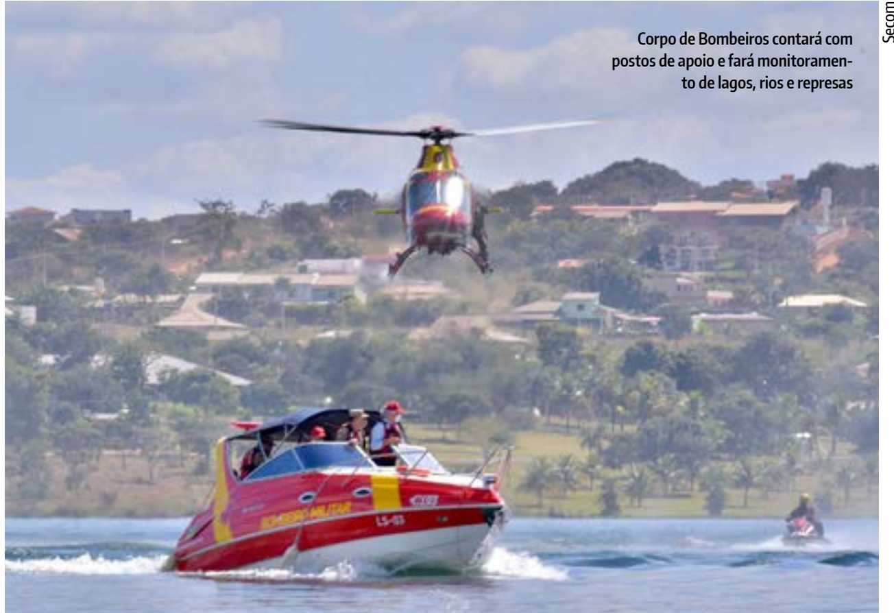
Corpo de Bombeiros contará com postos de apoio e fará monitoramento de lagos, rios e represas

O Corpo de Bombeiros Militar empregará efetivo extra de 214 militares, além de 71 viaturas, 23 embarcações e 29 mergulhadores durante o feriado prolongado. Além das 50 unidades operacionais espalhadas pelo estado, o CBMGO terá reforço no efetivo em 24 pontos de apoio montados em