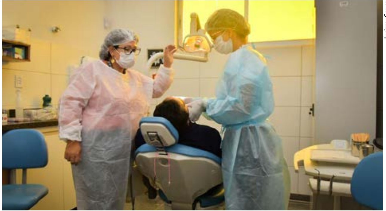
Programa Saúde Mais Perto de Você ocorre neste sábado (18/02), no CSF Buena Vista: serão disponibilizadas 400 consultas médicas em oftalmologia, 300 exames de ultrassonografia e eletrocardiograma, dentre outros atendimentos

Residencial Buena Vista I, Região Oeste da capital. O atendimento aos moradores ocorre das 08h às 17h. “A primeira edição do Programa Saúde Mais Perto de Você, na Região Noroeste, foi muito positiva, com centenas de atendimentos realizados. A prefeitura conseguiu al-