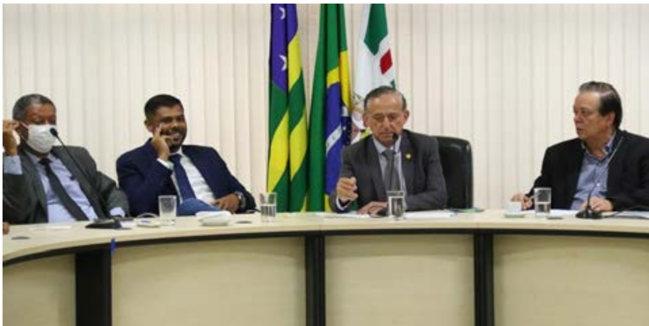
Câmara Municipal de Goiânia

Em reunião realizada na Câmara Municipal nesta quarta-feira (08/02), secretário de Governo, Jovair Arantes, conversou com parlamentares e anunciou que pasta terá encontros periódicos com vereadores para discutir execução de emendas impositivas e avançar no atendimento às demandas da população. Ele entregou cartilha que esclarece obrigações legais e procedimentos para adequada utilização do recurso