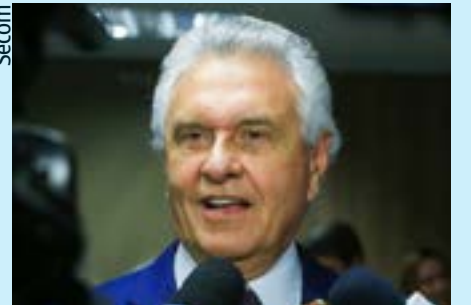
Fala de Caiado anunciando que não vai mais concorrer a eleições diz respeito só ao Estado, não ao país

Atenção, leitoras e leitores: passou despercebida uma fala muito relevante do governador Ronaldo Caiado, durante um recente evento dedicado aos deputados estaduais eleitos, no Palácio das Esmeraldas, quando sinalizou com 100% de clareza para o seu futuro pessoal e político.