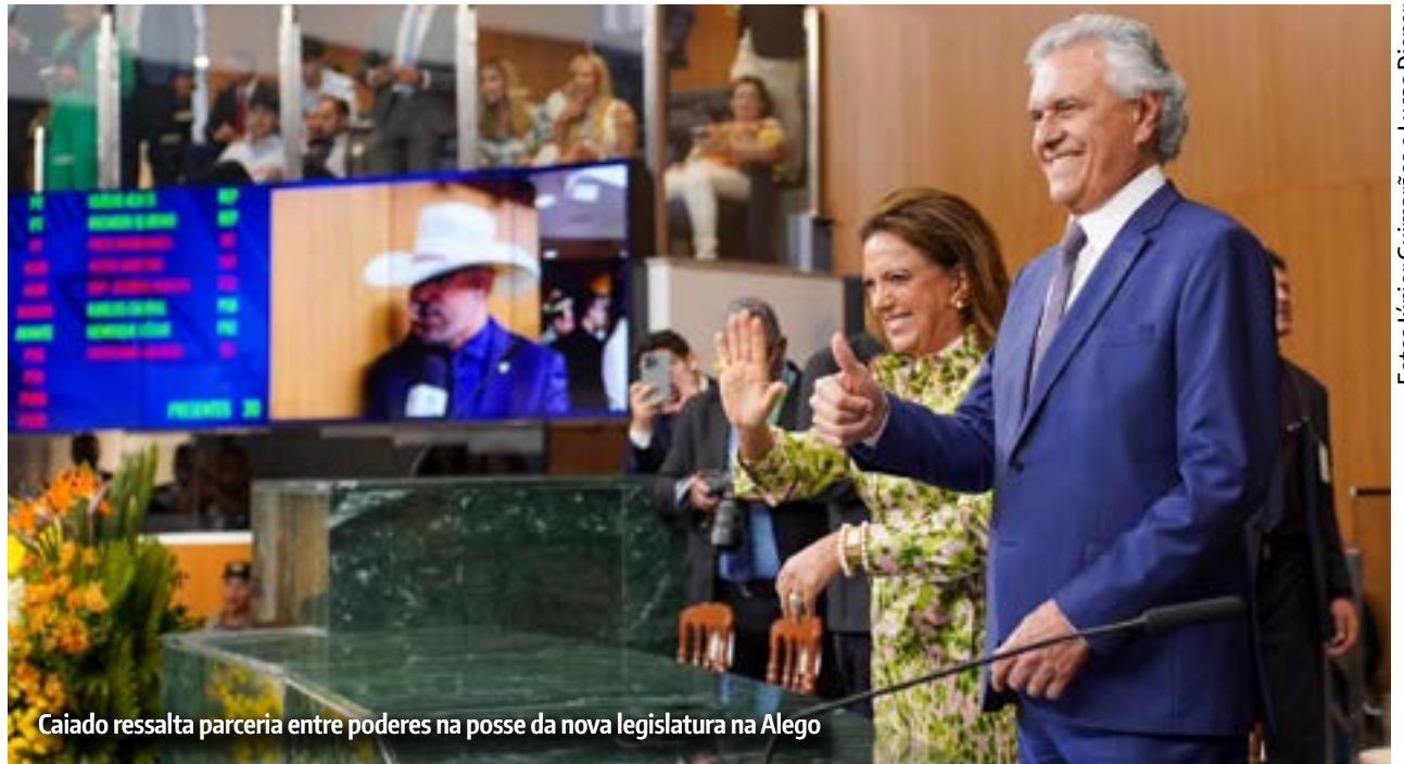
Caiado ressalta parceria entre poderes na posse da nova legislatura na Alego

Caiado também ressaltou a recuperação fiscal do Estado realizada em seu primeiro mandato, com apoio dos deputados na Alego, o que permitiu a retomada dos investimentos, e enfatizou a necessidade de reforçar os programas sociais. “O trabalho dos de-