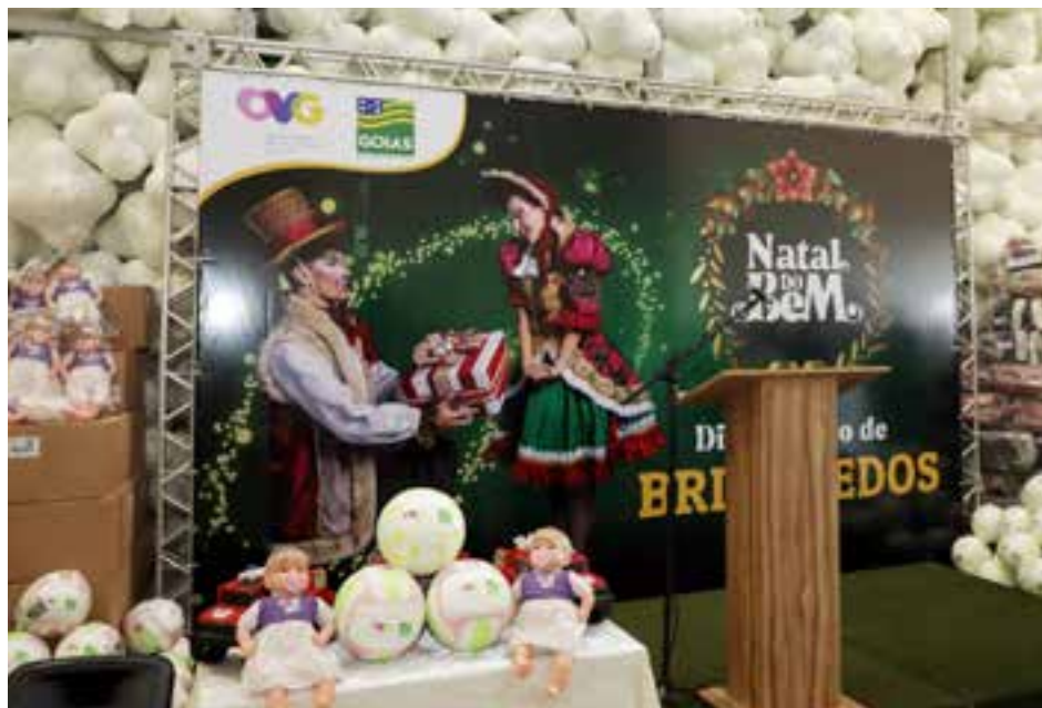
Brinquedos entregues pelo Governo de Goiás chegam a quase uma centena de municípios