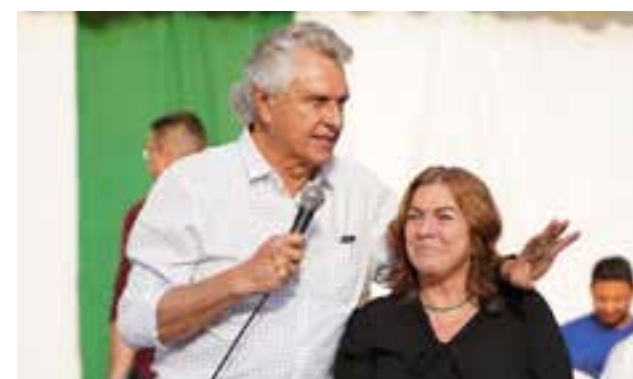
Governador Ronaldo Caiado e secretária da Educação, Fátima Gavioli: pagamento de diferenças salariais a servidores da Educação começou a ser feito ainda no início desta gestão, em 2019

rença para quem recebeu”, comenta a secretária da Educação, Fátima Gavioli. “O pagamento dessas diferenças salariais, para além de regularizar pendências, injetou milhões em recursos no comércio, na indústria, na prestação de serviços em todo o Estado”, completa a titular da pasta. De 2019 a 2022 foram