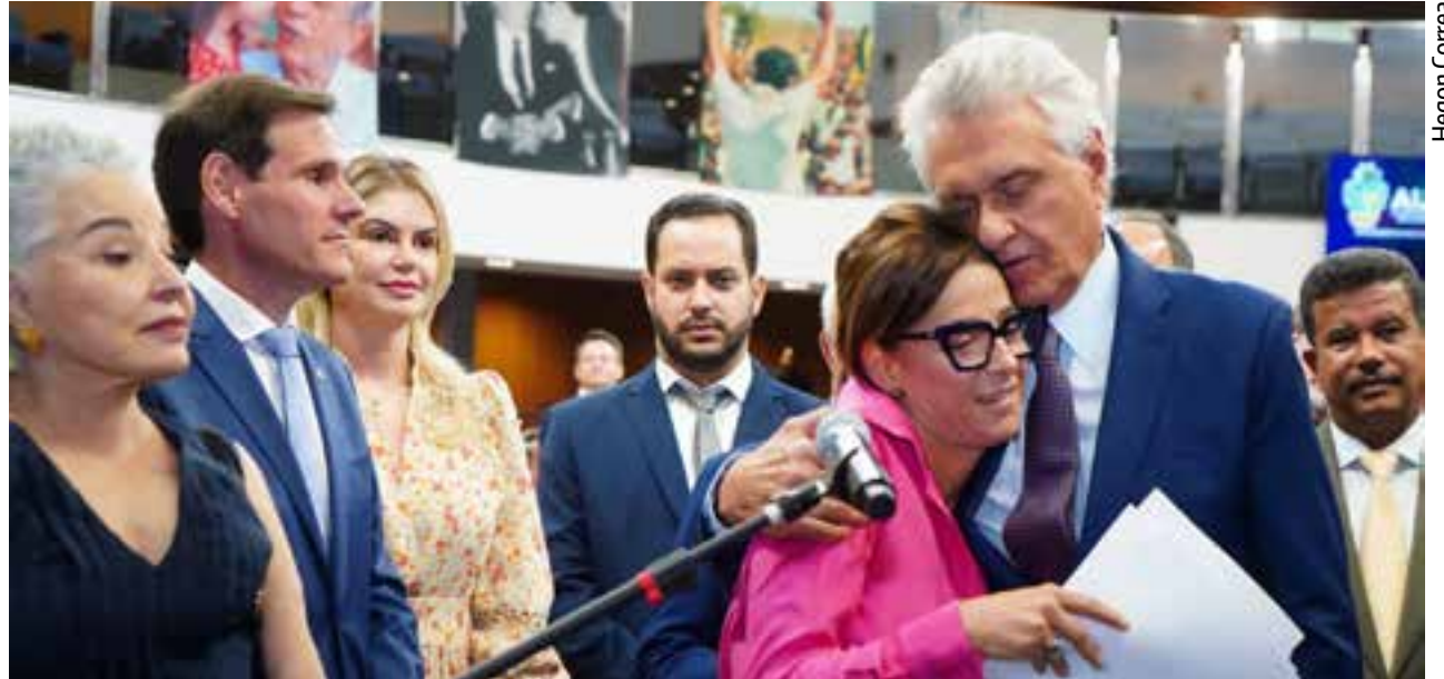
Governador Ronaldo Caiado prestigia homenagem ao ex-governador Iris Rezende, na véspera da data de 1 ano do falecimento do político

Em momento de descontração, o governador