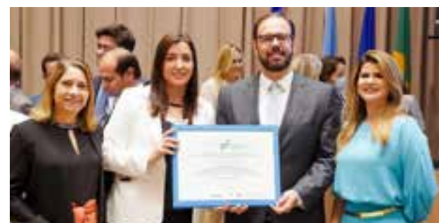
Secretário de Estado da Saúde, Sandro Rodrigues, e a subsecretária Danielle Jacques recebem premiação do Ibross/Opas ao Crer, Hugol e HGG

Para formar esse ranking inédito, os 6,6 mil hospitais brasileiros foram analisados por meio de critérios rígidos.