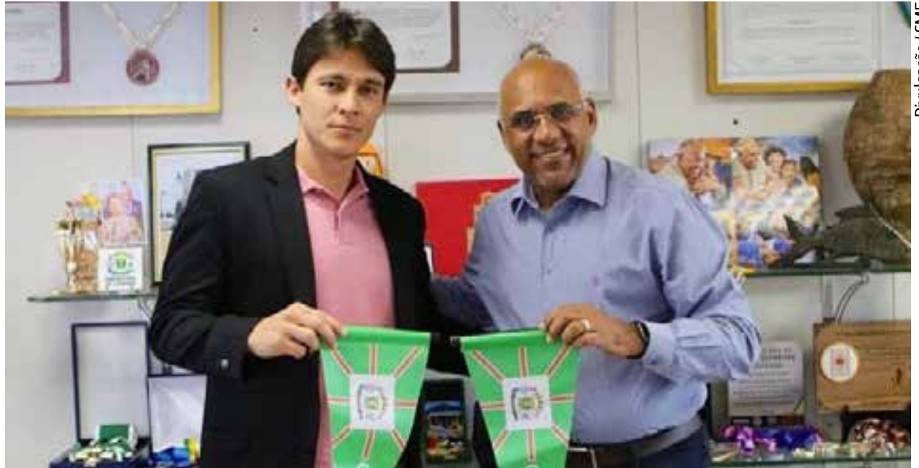
Servidor da rede municipal de ensino de Goiânia vai apitar a Copa do Mundo, no Qatar: goiano viajou para treinamento na terça-feira, 08/11

“Hoje no Brasil temos 10 assistentes do quadro internacional. A FIFA faz a seleção de acordo com a nossa atuação em com-