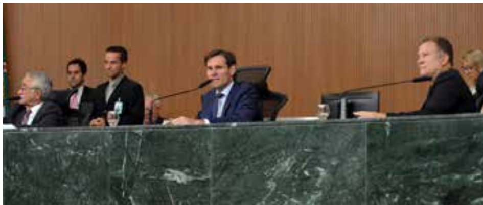
Nos encontros, além de apresentação de matérias, requerimentos e debates, os parlamentares promoveram, também, 75 deliberações, sendo que 10 dessas matérias foram votadas em fase definitiva

Em texto que justifica a matéria, o governador explica que a revisão foi feita por uma comissão técnica da Secretaria de Estado da Casa Civil e contou com a análise de 9.288 leis publicadas entre os anos de 1990 e 2018. Como resultado, a propositura sugere