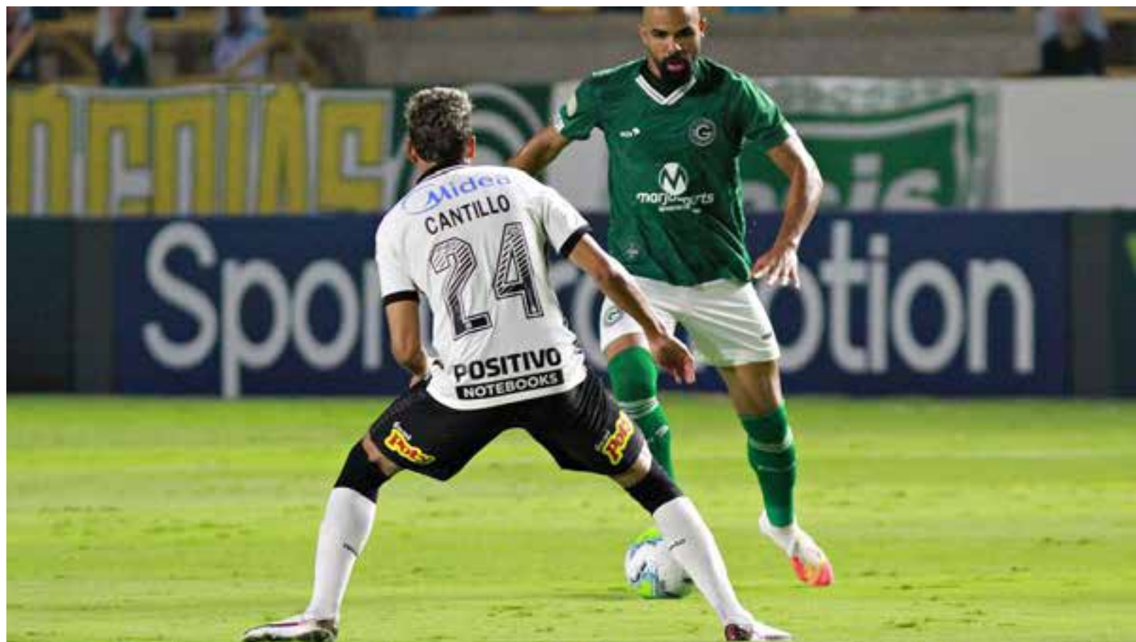
Goiás Esporte Clube

O resultado da partida atrasada 32ª rodada do Brasileirão - o jogo foi adiado pelo STDJ para este sábado (29) devido à divergência sobre a presença de público na Serrinha - deixou o Timão na quinta posição da tabela, com 58