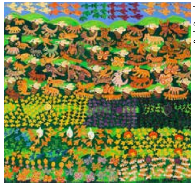
Peça “A Ecologia”: cores vibrantes e natureza estão presentes na obra de Antônio Poteiro

Antônio Batista de Souza nasceu em Portugal e veio para o Brasil com um ano de idade. Com a família, morou em São Paulo e Minas Gerais. Em 1955, mudou-se para Goiás, residindo em Nerópolis, onde ganhou o apelido de Poteiro. Em 1967, fixou residência em Goiânia e, aos 42 anos de idade, passou a criar peças autorais e a assinar sua obra em cerâmica como Antônio Poteiro. A partir de 1972, passou a pintar e seu imaginário transitou da materialidade do barro para o universo vibrante da cor.