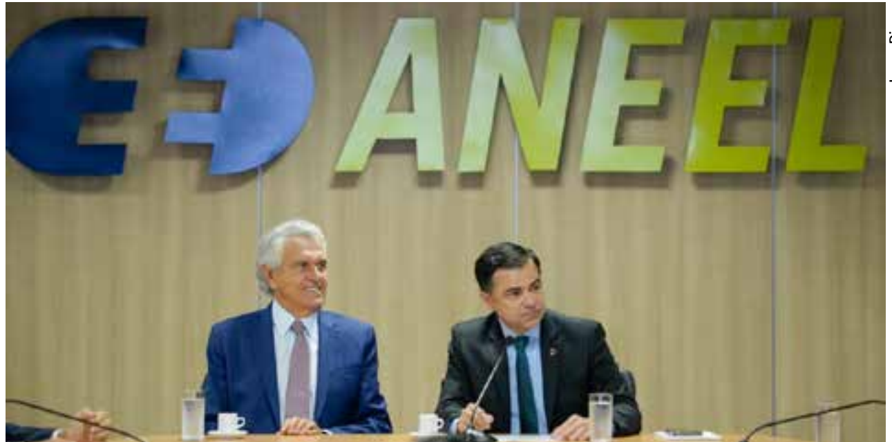
Em Brasília (DF), governador Ronaldo Caiado se reúne com diretoria da Agência Nacional de Energia Elétrica (Aneel) para discutir situação da distribuidora de energia elétrica Enel em Goiás

“Posso assegurar que tudo que for possível será feito, considerando o período de maior incidência de chuvas, a fim de minimizar os impactos aos consumidores de energia elétrica no Estado de Goiás”, destacou o diretor-geral da Aneel, Sandoval de Araújo Feitosa Neto. “O serviço de distribuição é muito sensível e não pode haver descontinuidade. Nós nos comprometemos aqui a manter o acompanhamento que já fazemos. A possibilidade