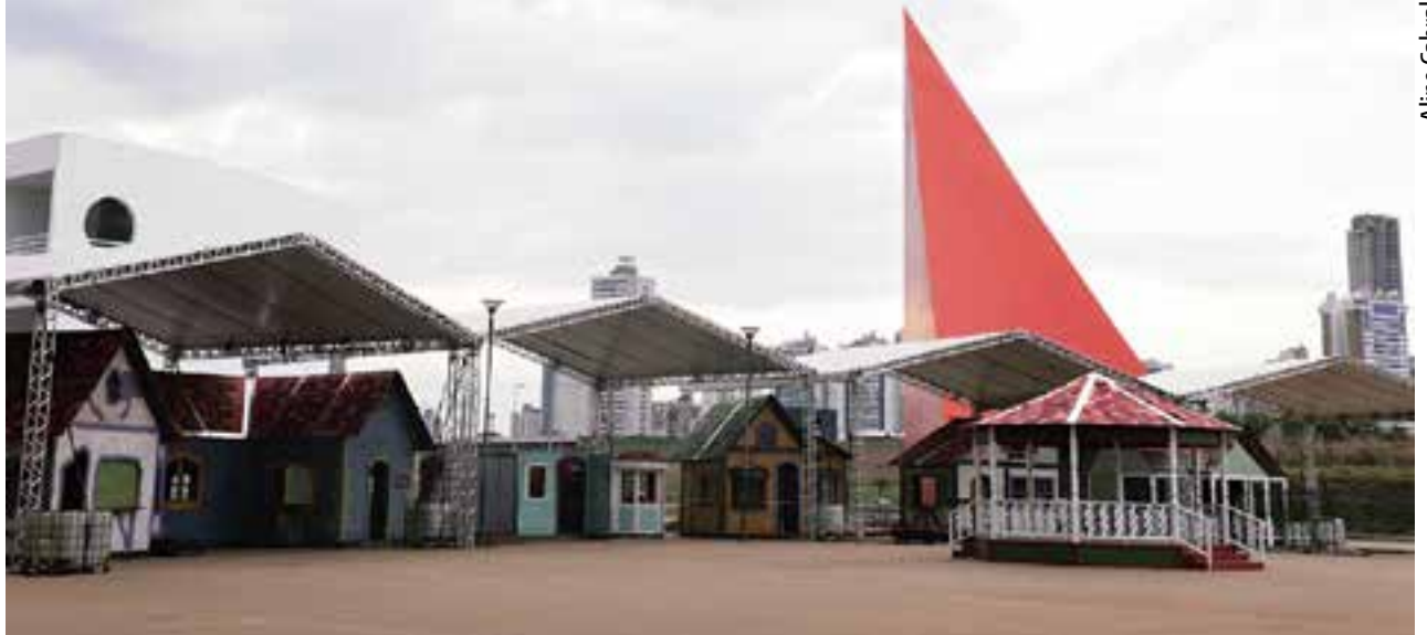
Centro Cultural Oscar Niemeyer está ganhando novo visual com o início da montagem do Natal do Bem da OVG e do Governo de Goiás

Papai Noel do Natal do Bem recebeu um público recorde de visitantes. Foram quase 200 mil pessoas, entre adultos e crianças. Em 2022, a expectativa é que esse número seja ainda maior, consolidando o evento como uma das maiores celebrações de Natal do país.