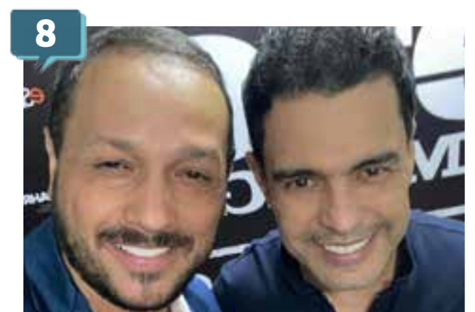
Fred Silveira e Zeze di Camargo