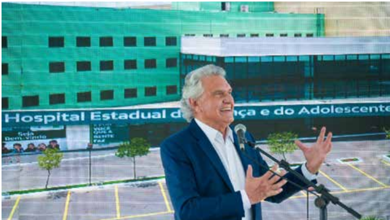
Hecad conta com consultórios de especialidades como cardiologia, pneumologia, alergia/imunologia, neurologia, endocrinologia, cirurgia pediátrica, gastroenterologia e outros

“Vamos licitar primeiro a ala de oncologia infantil. Essa parte terá estrutura para que pai e a mãe acompanhem as crianças. Precisamos de uma retaguarda para que eles possam compartilhar de tratamento mais longo. Vai ser mais um hospital do SUS, voltado a todos que precisarem”, garante Caiado. A Secretaria de Saúde (SES) deu início a estudos e cálculos necessários para a confecção do projeto executivo e do procedimento licitatório. Em todas as sete unidades próprias e 12 hospitais conveniados situados na capital, o Governo de Goiás investiu R$ 396 milhões nos últimos três anos e nove meses. O Hospital Estadual da Criança e do Adolescente (Hecad) foi inaugurado em fevereiro para suprir um problema antigo de estruturação dos serviços