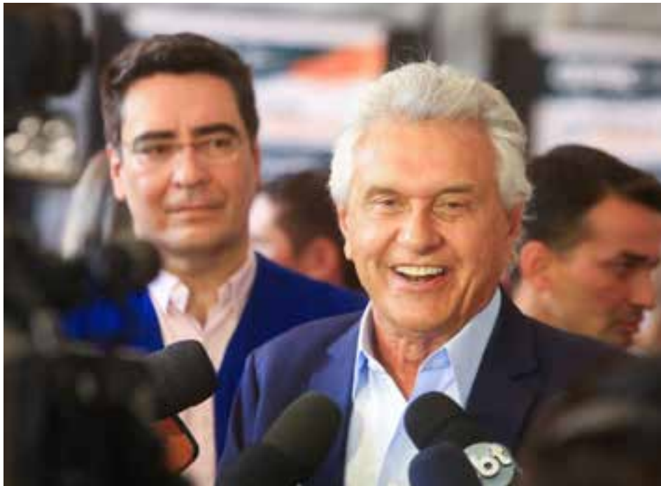
Governador Ronaldo Caiado: "o emprego é a maior política social que existe no mundo"

Até sábado (22/10), 11ª edição do evento oferece mais de 10 mil vagas de trabalho, cursos de qualificação, entrevistas de emprego, acesso a linhas de crédito e consultoria para micro e pequenos empresários