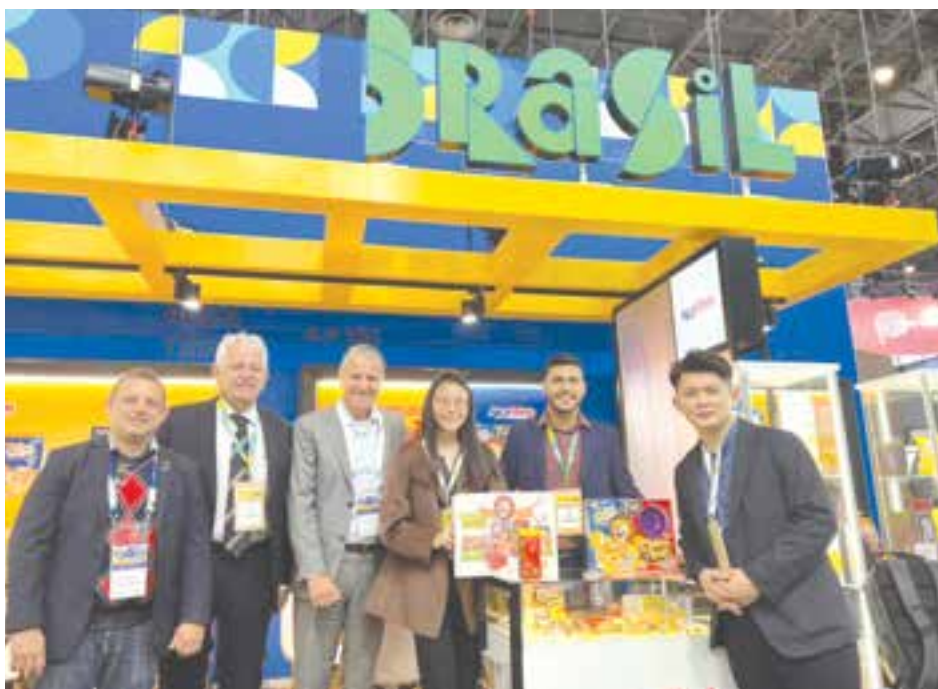
SIC, OVG e empresários goianos participam da Sial Paris, maior feira de alimentos e bebidas do mundo

Com 127 países presentes e mais de 7.000 expositores, a organização do evento espera receber 300 mil visitantes até nesta quarta-feira (19/10), último dia da feira. Na Sial participam representantes das seguintes empresas: São Salvador Alimentos/SSA (Itaberaí); JBS (Goiânia); Minerva Foods (Palmeiras de Goiás); Plena Alimentos (Porangatu); Milhão Ingredients (Goianira); Alca Foods (Itumbiara);