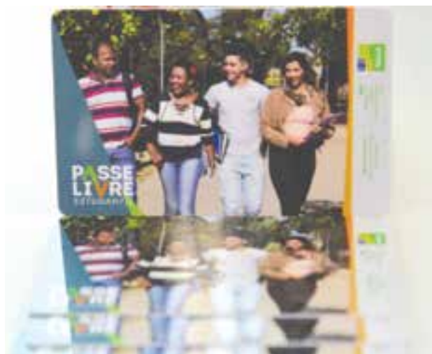
Prazo para cadastramento e recadastramento do Passe Livre Estudantil vai até dia 31 de outubro

Desde o mês de janeiro, 82 mil estudantes efetuaram o procedimento. O benefício concedido pelo Governo de Goiás garante 48 viagens por mês para deslocamento de ida e volta de casa à instituição de ensino. O saldo do cartão não é cumulativo, ou seja, se o aluno não utiliza todos os créditos, no mês seguinte é depositada apenas a diferença para completar