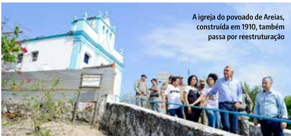
A igreja do povoado de Areias, construída em 1910, também passa por reestruturação

"Precisamos revitalizar a nossa história e nos apaixonar por nossas raízes, sem deixar que elas desapareçam. Além disso, vamos alavancar a economia local incentivando ainda mais o turismo, extremamente importante para esta