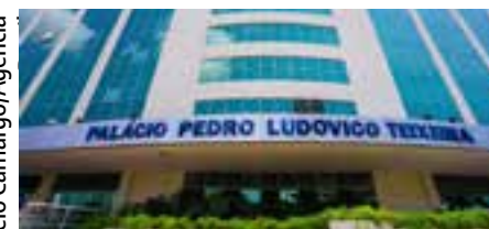
Veja o que abre e fecha no feriado de amanhã