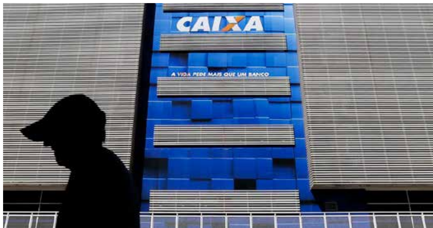
Pagamento do Auxílio Gás também começa nesta terça-feira - ECONOMIA | 4