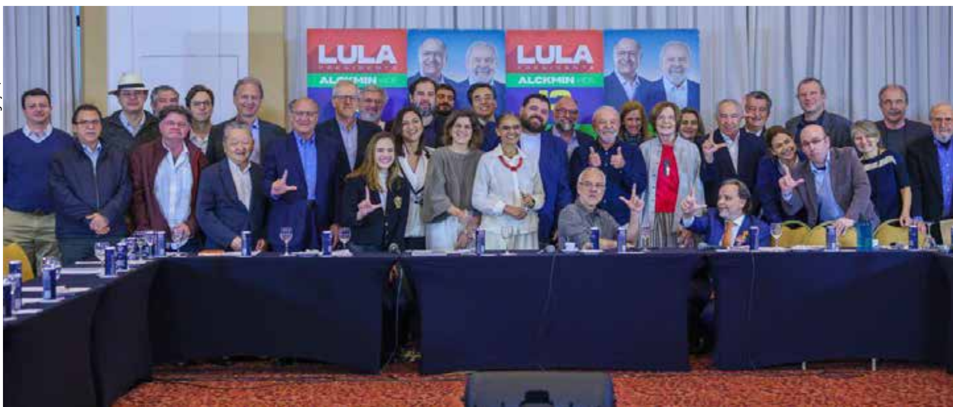
Nomes da economia, educação e meio ambiente se reuniram com Lula