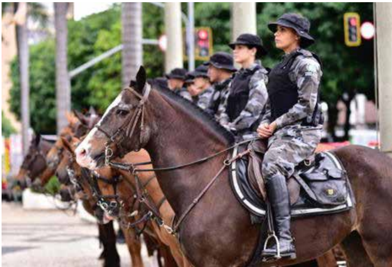
Secretaria de Estado da Segurança Pública (SSP) participa da Operação Eleições 2022 com 4.868 policiais militares, 448 bombeiros militares e 590 servidores da Polícia Civil entre delegados, agentes e escrivães.

O Corpo de Bombeiros Militar de Goiás também estará à disposição da população e participa da operação com um efetivo de 448 militares e 210 viaturas. O apoio da SSP-GO à Operação Eleições 2022 visa manter a ordem pública, além de