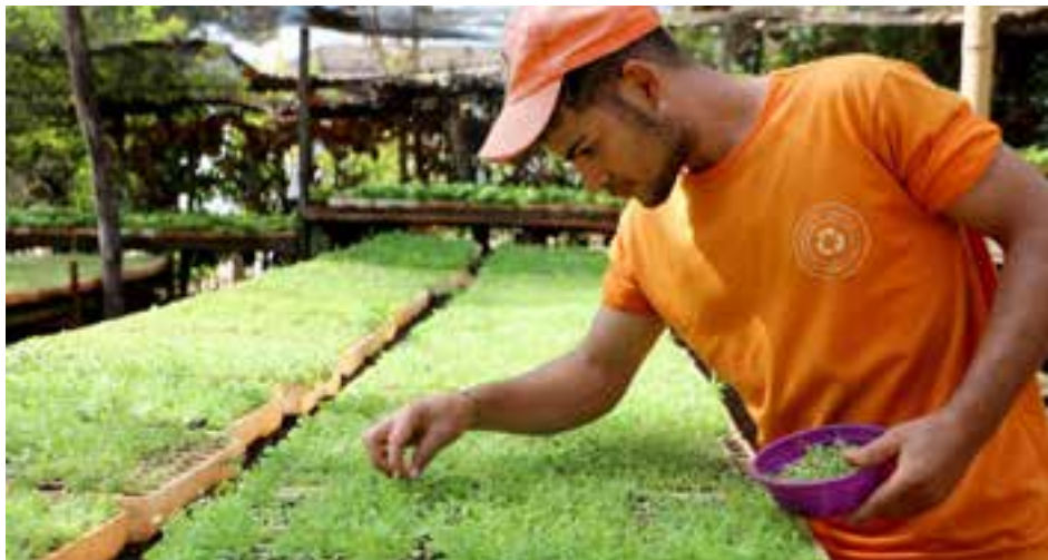
Todo o processo de cultivo é realizado artesanalmente seguindo diversas etapas para garantir a qualidade

"Já está sendo feita a seleção das novas mudas ornamentais que serão utilizadas nos próximos projetos paisagísticos da cidade, portanto, em breve poderá ser vista uma Anápolis mais bonita e florida para a época da chuva", declara a diretora de praças, parques e jar-