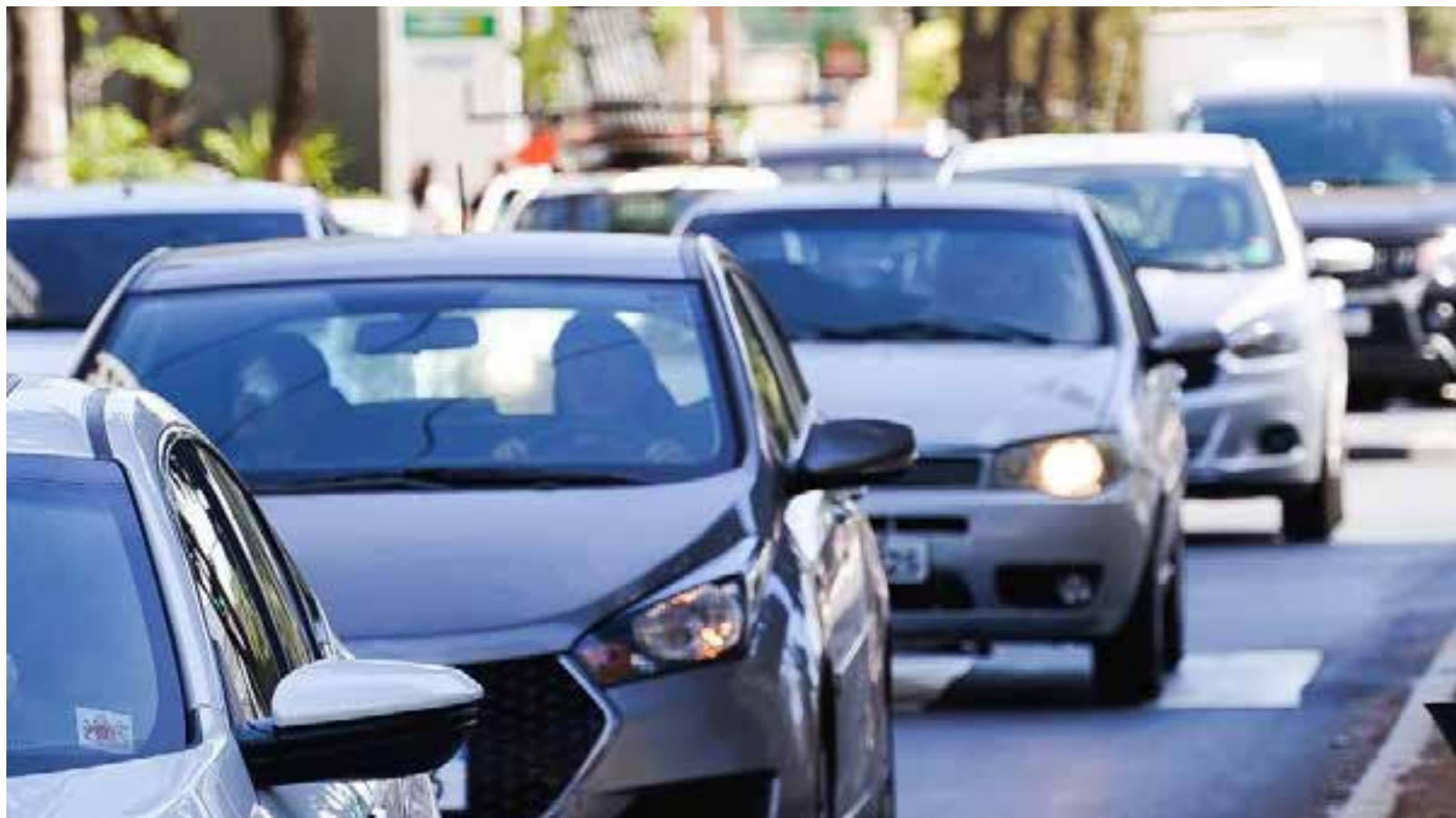
Desconto no IPVA para proprietários de veículos é proporcional ao valor das notas fiscais acumuladas

O acúmulo de notas para obter o abatimento no IPVA 2023 segue até final do mês de novembro. O desconto é proporcional ao valor das notas fiscais. A cada R$ 100,00 em compras, o sistema eletrônico