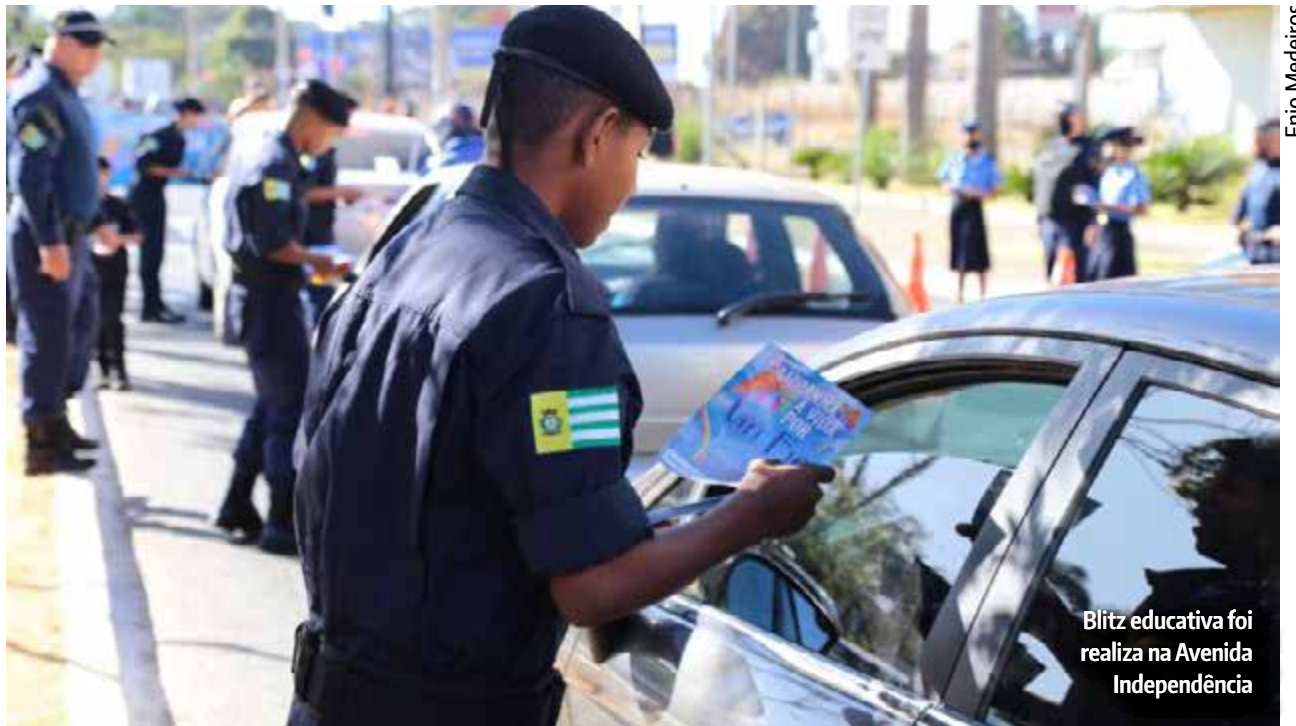
Blitz educativa foi realizada na Avenida Independência

"Iniciamos esse trabalho de conscientização porque infelizmente perdemos uma vida em nossa cidade há cerca de 11 anos. Hoje, percebemos