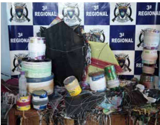
Material apreendido durante campanha e encaminhado ao depósito da GCM e posteriormente destruído