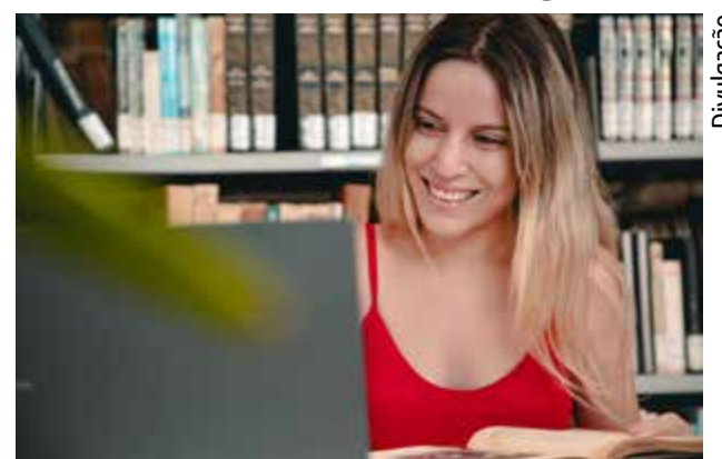
O prazo para a renovação vai até o dia 18 de julho

matriculados em cursos da rede privada de ensino superior. O candidato que se inscreve no programa Graduação passa por um processo de seleção que vai desde a entrega da documentação até a visita de um assistente social. Após aprovado, o estudante deve realizar a renovação da bolsa universitária para garantir a permanência do benefício.