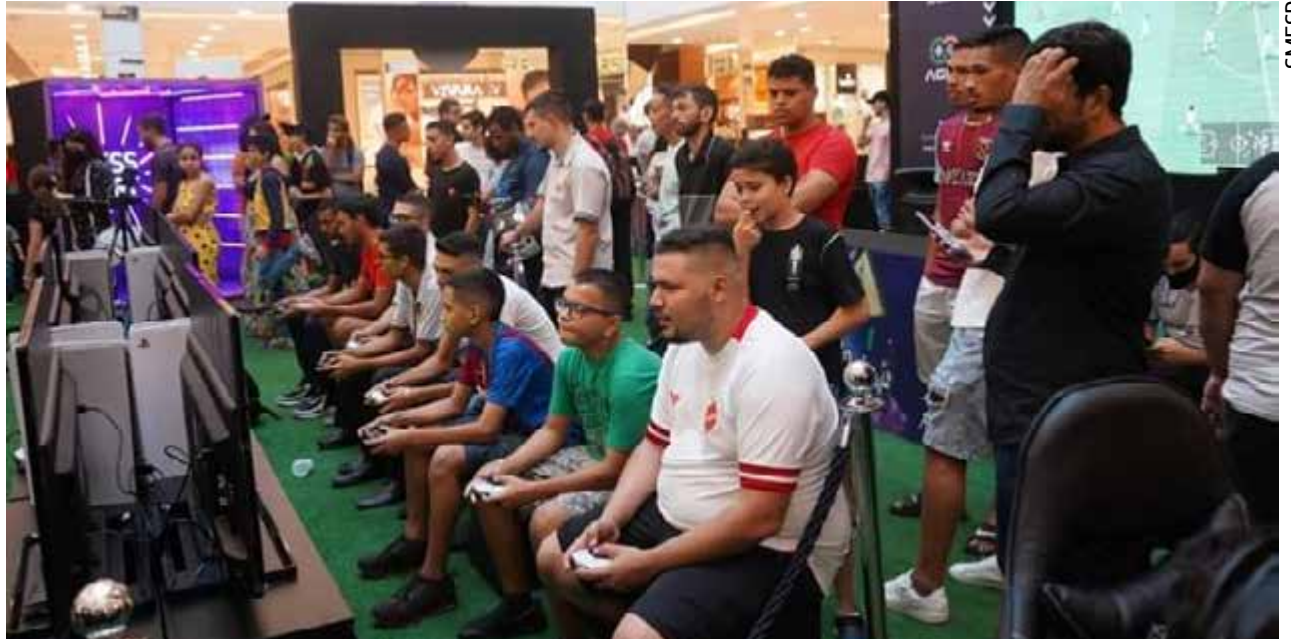
Com apoio da prefeitura, capital sedia finais da segunda etapa da II Copa Goiânia de E-Sports, neste sábado (09/07) e domingo (10/07): competição será no Portal Shopping, aberta ao público, que pode jogar gratuitamente

League of Legends (LOL), que faz a primeira classificatória. Durante a semana, as equipes disputam as partidas eliminatórias, e as classificadas competem na final deste sábado e domingo.