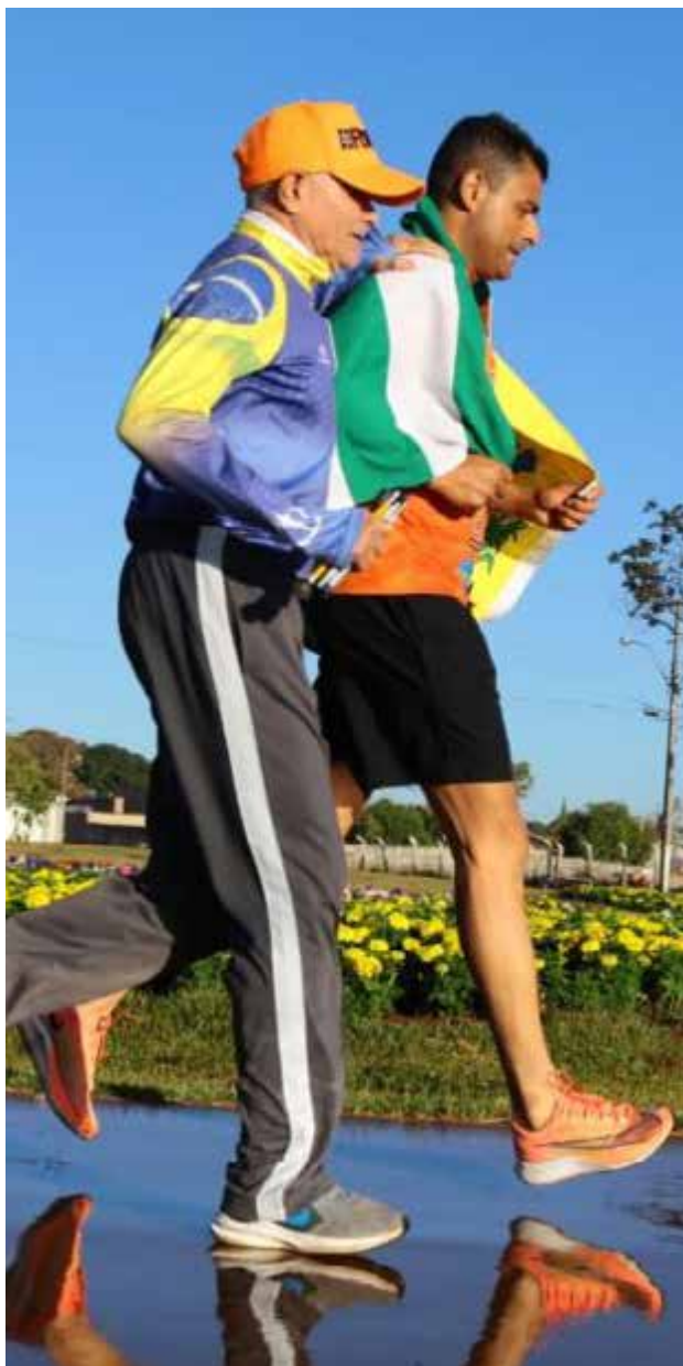
Atletas treinam pela manhã na praça da Cidade Administrativa Maguito Vilela

A tradicional corrida dos aparecidenses retorna no domingo, 10. Os atletas inscritos podem retirar os kits nos dias 8 e 9, no Espaço Centenário