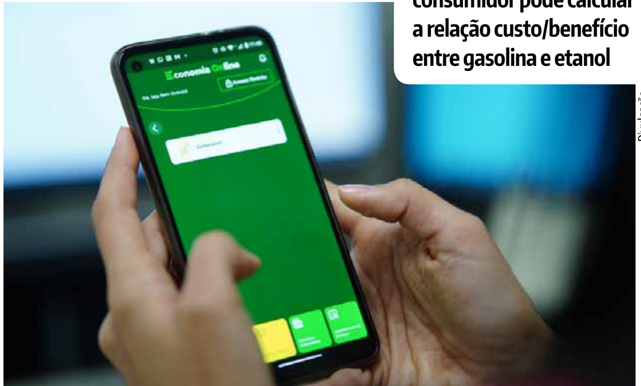
Desde o lançamento, em 2020, o aplicativo EON já foi baixado por mais de 100 mil usuários

Desde o lançamento, em 2020, o aplicativo EON já foi baixado por mais de 100 mil usuários. Por meio dele também é possível acessar as principais notícias da Secretaria da Economia, pagar tributos e agendar serviços. Confi-