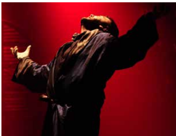
Grupos de teatro goianos vão para festival na França: participação foi viabilizada por meio do Edital de Intercâmbio do Fundo de Arte e Cultura

O Festival OFF de Avignon é um Festival Internacional de Teatro que