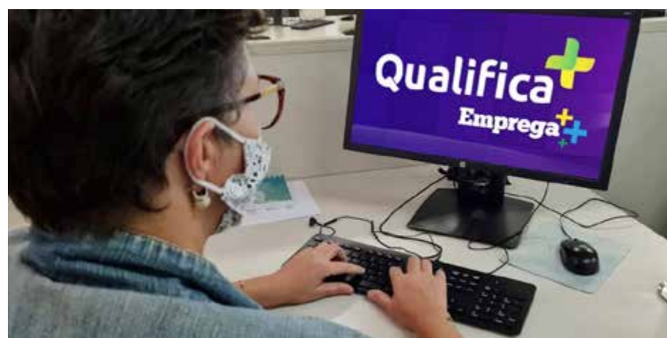
São três editais abertos, cujas inscrições se encerram em duas datas distintas: 17 de julho e 24 de julho

disponível para 16 municípios. O perfil dos cursos leva em conta a vocação econômica e a demanda do setor produtivo local. No Entorno do Distrito Federal, por exemplo, são ofertadas 1,6 mil vagas e há opções para assistente de contabilidade, gestor de microempresas, entre outros. Já para o Sudeste Goiano, Rio Verde e Jataí somam 350 vagas para cursos de operador de empilhadeira, operador de processamento de grãos e cereais, e assistente de logística. Entre os pré-requisitos para os candidatos estão idade mínima de 16 anos e certificado