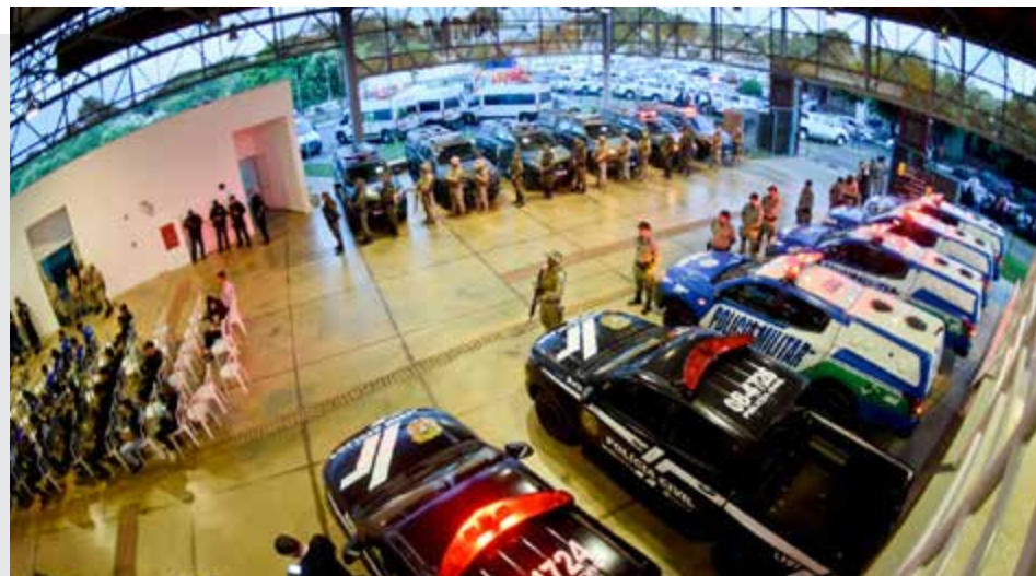
Governo de Goiás repassa à segurança pública novos equipamentos. Foram entregues coletes balísticos, quatro viaturas náuticas e 19 veículos para Polícia Civil