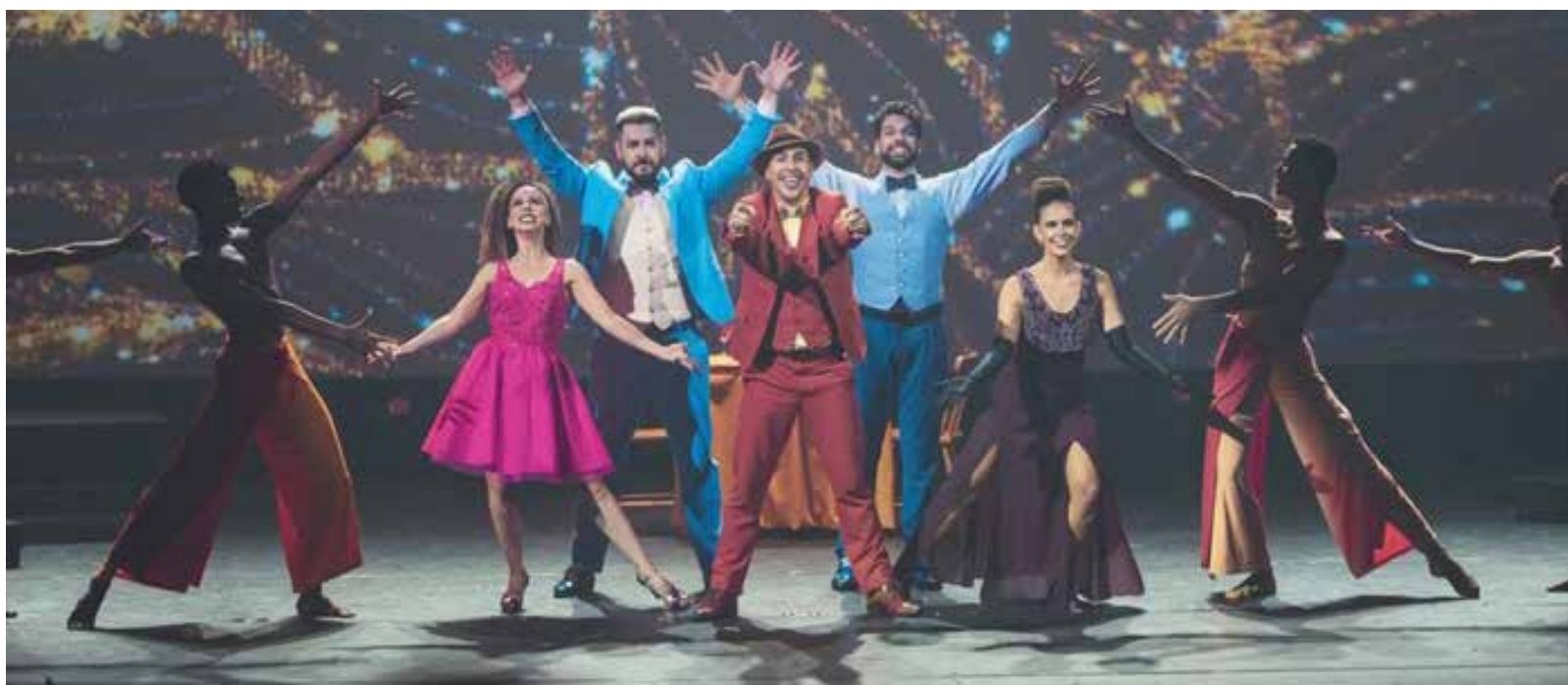
7X Pecado – Broadway in Concert apresenta uma aposta entre Deus e o Diabo sobre a força do amor. Apresentações gratuitas acontecem de 9 a 14 de junho no Teatro Escola Basileu França

A entrada é franca, mas é preciso retirar o ingresso gratuito, que já está disponível por meio da plataforma Sympla. Basta escolher o dia que deseja acompanhar e fazer a reserva.