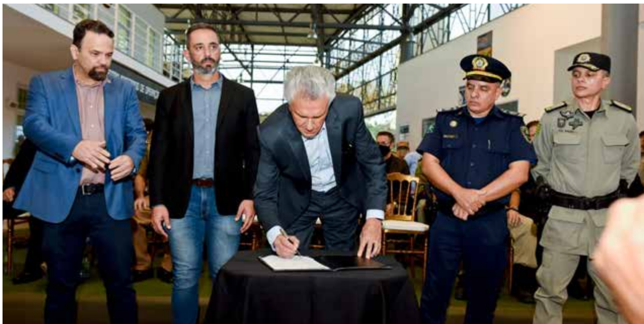
Caiado entrega novas instalações do Centro Integrado de Comando e Controle do Comando de Operações de Cerrado (COC) da Polícia Militar

“Quero ser justo e, cada vez mais, valorizar as forças de segurança, para que se sintam em condições de debelar o crime e construir em Goiás uma área, um território, onde as pessoas vivam em paz”, explicou o governador ao entregar o espaço e os novos equipamentos. “Não é por acaso que a nossa segurança é a melhor do país. É porque aqui há profissionalização, integração, modernização