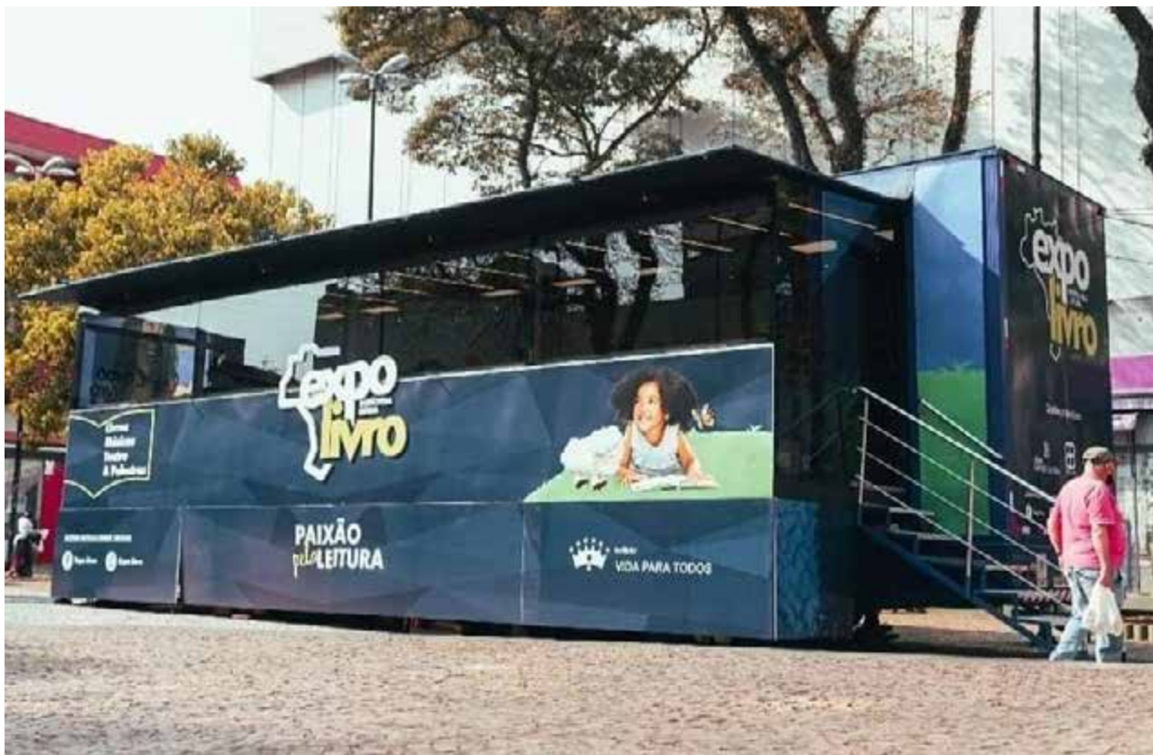
Com o apoio da Prefeitura de Anápolis, o veículo estará estacionado na praça Dom Emanuel até o dia 16, das 9h às 23h