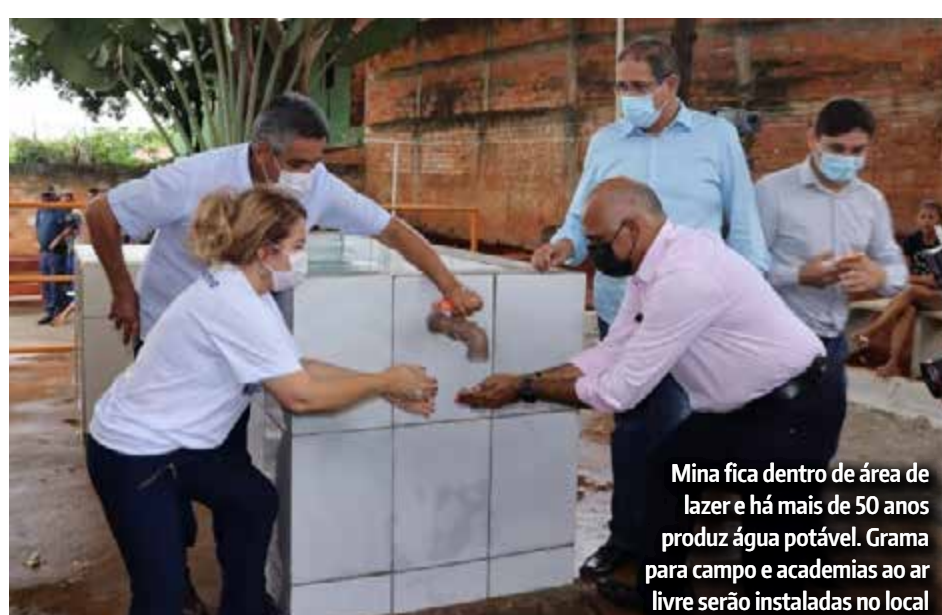
Mina fica dentro de área de lazer e há mais de 50 anos produz água potável. Grama para campo e academias ao ar livre serão instaladas no local

A própria população canalizou a água da mina, há aproximadamente 20 anos, depositando-a numa espécie de caixa d'água ao lado da fonte, no subsolo do espaço onde brota a água. Hoje, revitalizada, além de proporcionar consumo, a mina tem destino direcionado passando por uma primeira fase de decantação, seguindo para uma segunda fase até chegar na rede pluvial. Além da fonte de água natural potável, existe ainda área de lazer, parque infantil, campo de futebol com