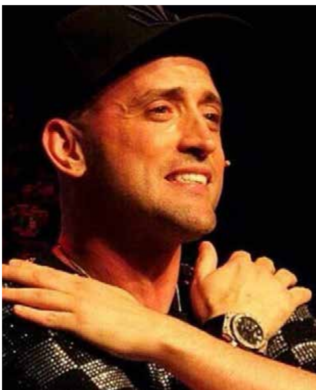
A Lei Paulo Gustavo, que foi aprovada no Senado e aguarda votação na Câmara, prevê liberação de R$ 3,8 bilhões para o setor

O setor cultural e de eventos foi um dos mais prejudicados pela pandemia de coronavírus. A crise sanitária levou ao fechamento de casas de shows e espetáculos devido à necessidade de isolamento social, deixando sem renda milhares de artistas brasileiros. Em audiências públicas e sessões de debates promovidas pelo Senado em 2021, representantes do setor apontaram prejuízos de aproximadamente R$ 270 bilhões e pediram apoio dos parlamentares.