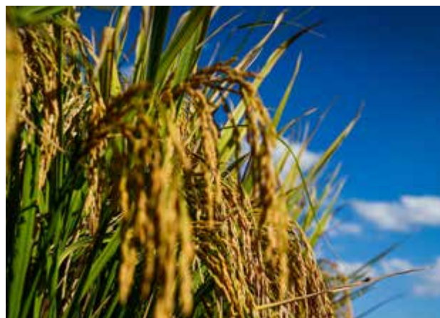
Outro indicador do bom momento do agro em Goiás é o das exportações

No caso do arroz, o salto foi de 8,7% em produção, passando de 120,4 mil toneladas para 130,9 mil toneladas. Para o ciclo 2021/2022, a projeção é de avanço de 21,7% na produção de grãos no Estado. Ao todo, Goiás deve colher 28,9 milhões de toneladas. A Co-