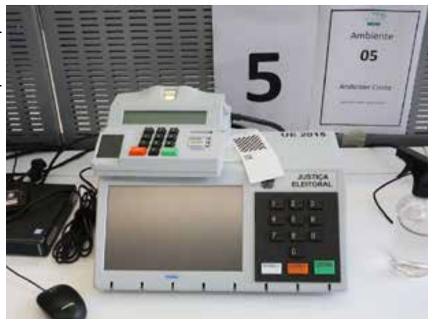
Durante seis dias, 26 profissionais de tecnologia da informação colocaram em prática ataques aos equipamentos e sistemas desenvolvidos para as Eleições Gerais de 2022

Ministro Roberto Barroso fará a apresentação às 16h