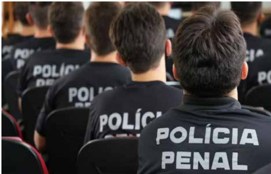
DGAP nomeou, por meio de portaria, uma comissão de policiais penais para trabalhar na proposta de progressão

Esta mesma legislação prevê em seu artigo 5º que o servidor tem direito à progressão após dois anos de efetivo exercício em cada padrão da classe que se encontra. Todavia, esta contagem é interrompida quando o servidor é penalizado com suspensão acima de 60 dias; ou afastamento não considerado de efetivo exercício; e ainda no exercício de atividades alheias às atribuições do cargo efetivo, em unidade administrativa não integrante da estrutura da Secretaria da Segurança