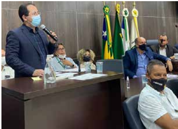
Encontro reuniu lideranças de classe e empreendedores locais. A novidade nessa parceria é que as cooperativas de crédito vão poder oferecer o crédito com aval do Fundeq