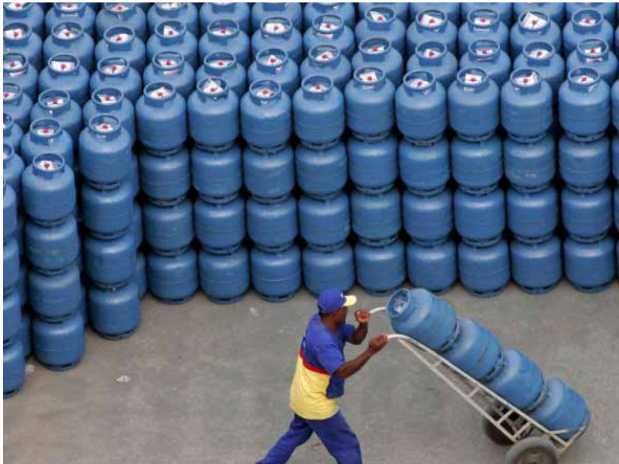
O pagamento começa em dezembro e, no primeiro mês, o Ministério da Cidadania informou que utilizará recursos próprios da pasta

O pagamento começa em dezembro e, no primeiro mês, o Ministério da Cidadania informou que utilizará recursos próprios da pasta, no valor de R$ 300 milhões. Para os paga-