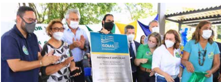
O governador Ronaldo Caiado durante inauguração da reforma do Ceja Arco-Íris, entrega de laboratório móvel de informática e benefícios para alunos da rede estadual de ensino, em Goiânia: “Estamos investindo para valer na Educação. Essa é a única maneira de quebrarmos o ciclo da pobreza”

“Se os alunos se empolgarem com a Educação, no futuro a renda de Goiás aumentará. Isso precisa ser colocado na cabeça de todos. Não saiam da escola”, pede o governador, demons-